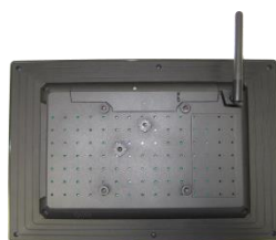
Встроенное крепление VESA